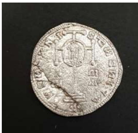
Slika 2. Srebrnjak „Miliaresion“ (Revers)

Revers: IHVSXRI – StVS NICA; Križ s hastama na krajevima, na stepeničastom postolju. Na križištu ovalni medaljon s poprsjem Romana I., s bradom, lorosom, krunom s pendilijima. U polju 1. R/±X±, d.m/A. Biserna kružnica (DUM ARH 4380)