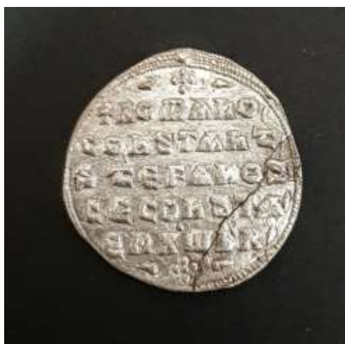
Slika 1. Srebrnjak „Miliaresion“ (Avers)

Avers: +ROMANVS/CONSTANTINVS/SEBASTVS/CECOnSTANTINVS/EnX'ob'R' u 7 redaka. Biserna kružnica (DUM ARH 4380)