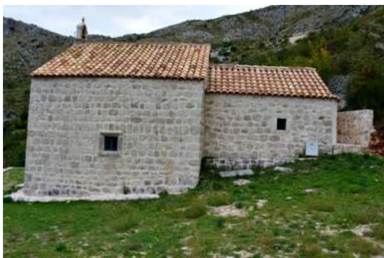
SLIKA 1. CRKVA SVETOG IVANA U PLATU

U Župi dubrovačkoj vatra se radila od kupine, kapinike, tetivike i drače, koja se pokosila po baštinama. Nastojalo se da kup raslinja bude što veći. Preskakalo se prema istoku, i to samo s jedne strane. Pri preskakanju je o Vidovu zabilježen uzvik: U ime Boga i svetoga Vida, preskočimo vještičja krila! Vjerovalo se da onomu tko preskoči vidovsku vatru vještica neće nauditi. Odrasli su preskakali uz uzvik: Sveti Vide, vidi mene, sveto Trojstvo, drieši mene! Osim uzvika U ime Boga i svetoga Ivana, preskočimo vještičja krila! uzvikivalo se i Od Ivanja do Ivanja, ne daj, Bože, žuja i naboja! Ideja i uloga trostrukog preskakanja iz Konavala, ostala je sačuvana u vjerovanju iz Župe da onaj koji preskoči sva tri ognja – vidovski, ivanjski i petrovski, te godine neće oboljeti od kužnih bolesti. Sv. Ivan posebno se svečano slavio u selu Platu, gdje i danas u brdu iznad sela, nedaleko od istoimene crkve, mladi ljudi izrađuju znak križa od kamenja, s inicijalima S I na bočnim stranama, na kojem zatim zapale i luminaciju , loptice od pepela i petroleja.