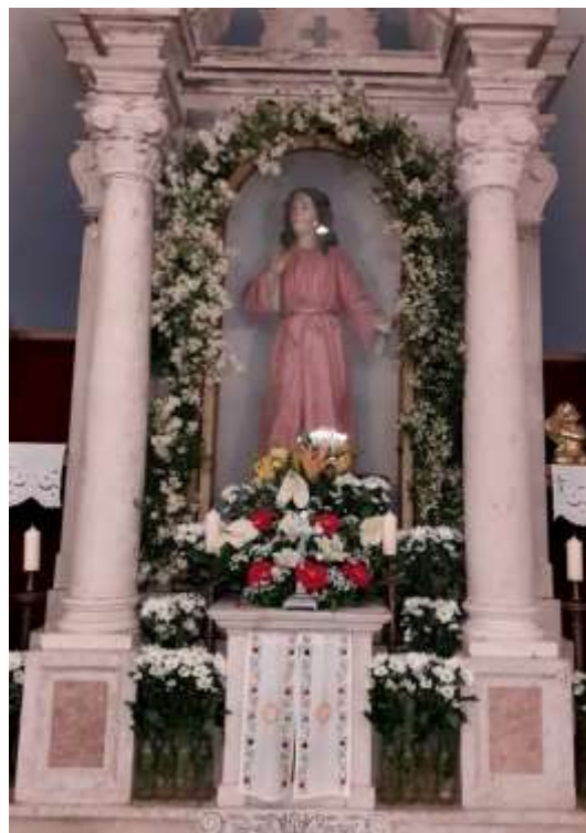
SLIKA 4. OKIĆENI LUK KIPA SV. VIDA U CRKVI SV. VIDA I MODESTA U SMOKOVLJANIMA

Vatre su u Dubrovačkom primorju nosile nazive radovanje (Mravinca) ili svitnjak (Trnova). U Trnovi su se od komada drveta donesenoga iz šume radila dva ili tri svitnjaka. Svaki preskok namjenjivao se određenoj osobi, pa se tako uzvikivalo: U ime Oca i svetoga Vida, ovo za moga oca! U ime Oca i svetoga Vida, ovo za moju mamu! , dok se uz vatru pjevala pjesma Budila majka Vidoja . Naziv svitnjak zabilježen je i u Blacama, gdje se uoči Sv. Ivana palila šikara, loza i slama, uz uzvik: U ime Boga i svetoga Ivana, ne daj Bože na gore! , a kupanjem u moru prije izlaska sunca, na sam blagdan, ljudi su vjerovali da će im nestati rane ili kraste, ako su ih imali. U Topolom su se vatre palile uoči Sv. Vida i Sv. Petra. Tamo je zabilježena i zanimljiva molitvica: Sveti Vide, Odavide, što po moru brode brodiš i po nebu zvijezde brojiš, pa ti tate slomi ruke, mrku vuku oštre zube. A da tate ne ukrade, mrče vuče ne zakolje, i vještice ne izjedu, da bi tako osvanulo moje stado svekoliko. Amen. U Smokovljanima u Dubrovačkom primorju blagdan sv. Vida i Modesta je bila glavna seoska festa, pa su uoči toga dana glavna vrata seoske crkve, kao i sam luk oko kipa sveca, kitili skorbuti.